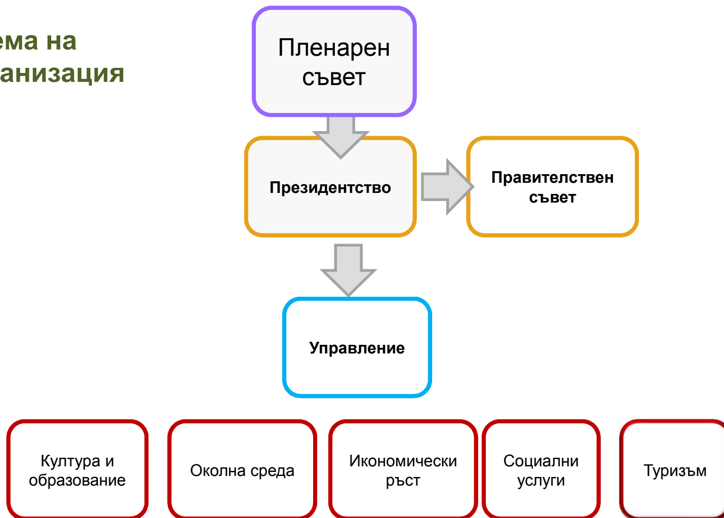
Схема на организация